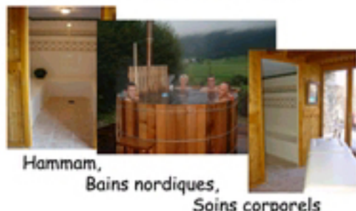
Hamman, Bains nordiques, Soins corporels